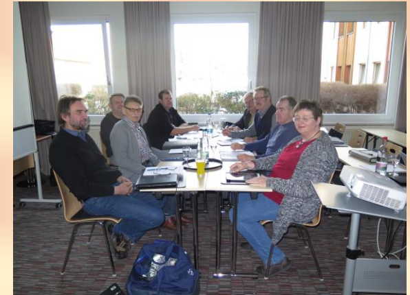
1. Vorstandssitzung des neuen Vorstandes

Weitere Informationen aus der Vorstandssitzung erfolgen in der nächsten Ausgabe der Newsletter!