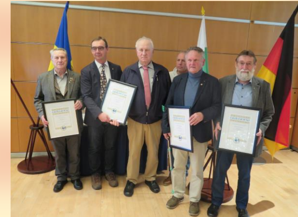
Die neuen Meister des VDT