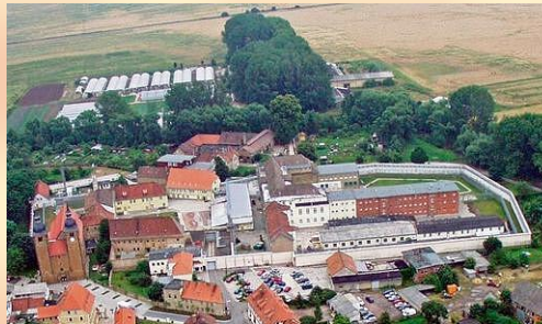
Tauben Ansicht auf Ichttershausen

Wer die Referenten sein werden, steht noch nicht fest. Jürgen Weichhold wird sich um Fachleute kümmern.