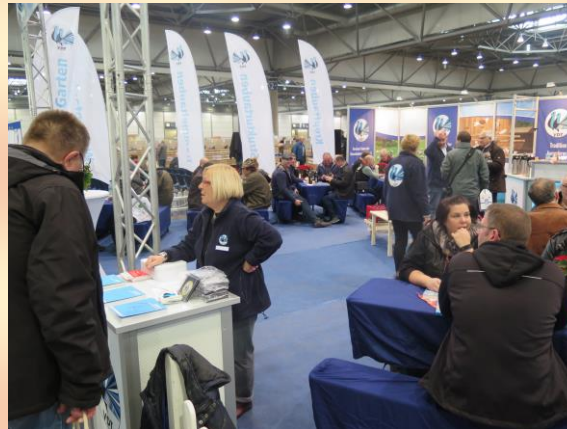
Reges Treiben im VDT Garten