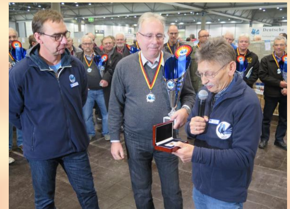
Übergabe Best in Show 2019

Weitere Informationen aus der Vorstandssitzung erfolgen in der nächsten Ausgabe der Newsletter!